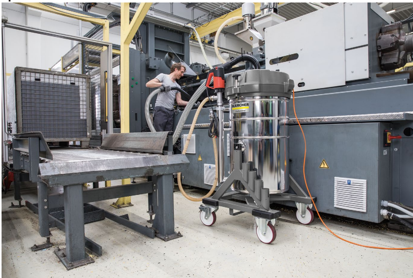
IVR-L 120/24-2 Tc